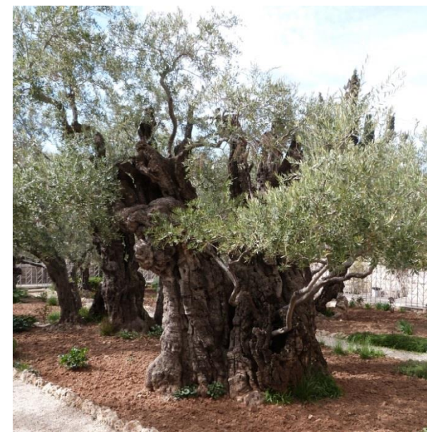
Le Jardin des Oliviers...

DIPLÔME UNIVERSITAIRE de FORMATION PASTORALE